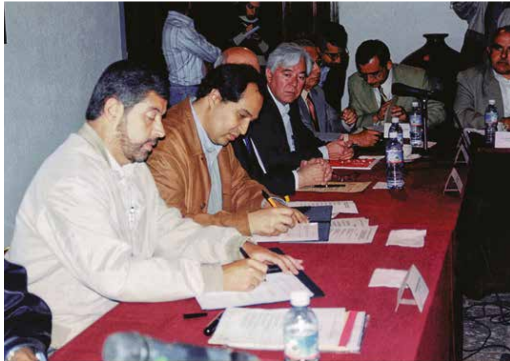
Firma del convenio entre el gobierno del estado, la sociedad propulsora del proyecto y representantes de la UNAM.