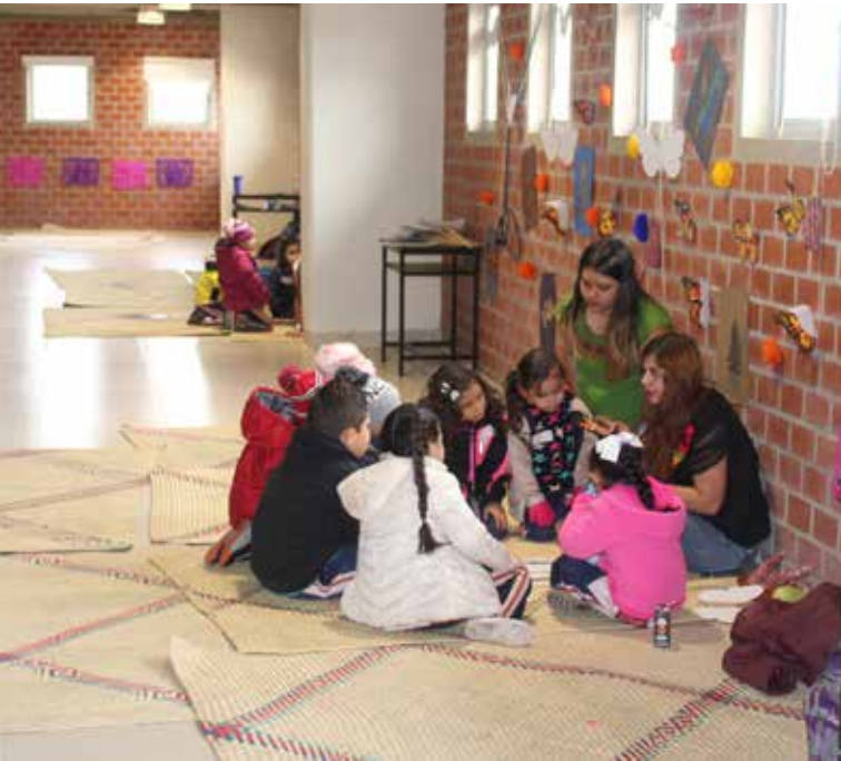
«Ve por ellos».