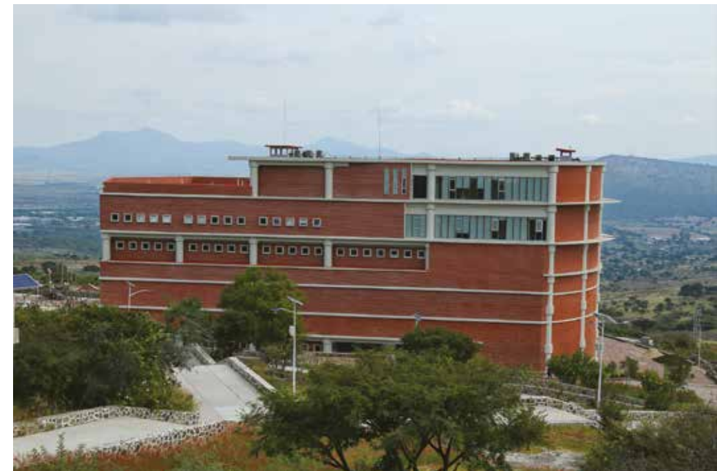
Edificio Central. En 2010, concentró toda la actividad académica y administrativa hasta la construcción del edificio A, donde se encuentran las aulas y laboratorios en el presente.