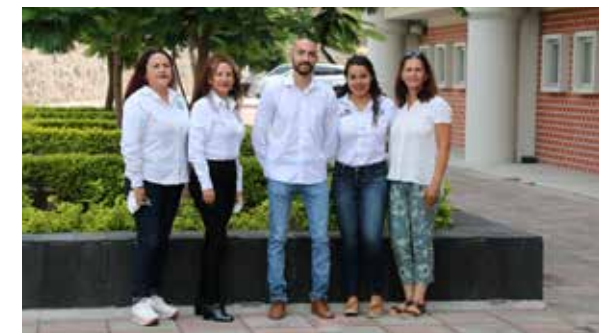
Idiomas y Posgrado