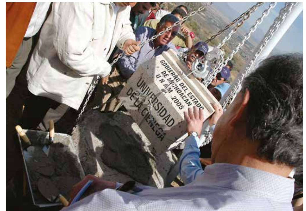
Colocación de la primera piedra.