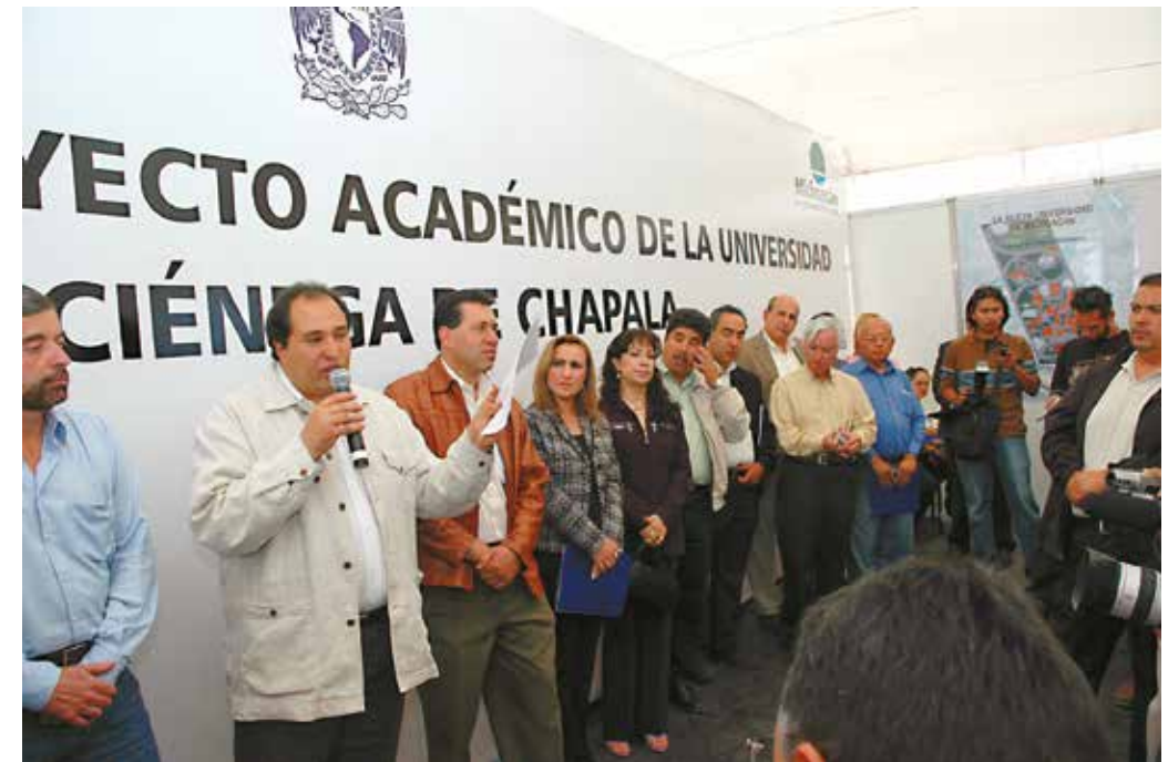
Acto protocolario de colocación de la primera piedra.

En este momento el proyecto se bifurcaba con los siguientes objetivos: el inicio de actividades en una sede alterna, programada para el 31 de agosto de 2006, y la construcción del edificio. Para el primero, se