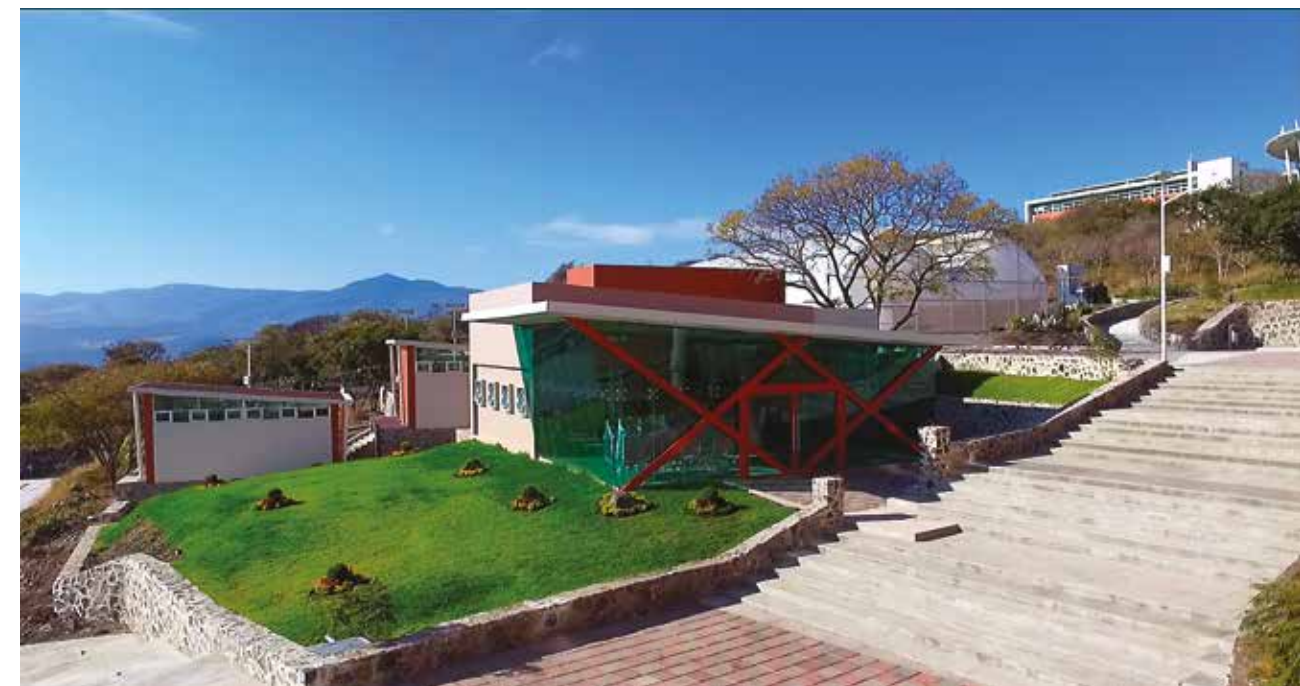
De la tierra a la mesa.