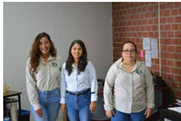
Tutoría y apoyo psicológico.