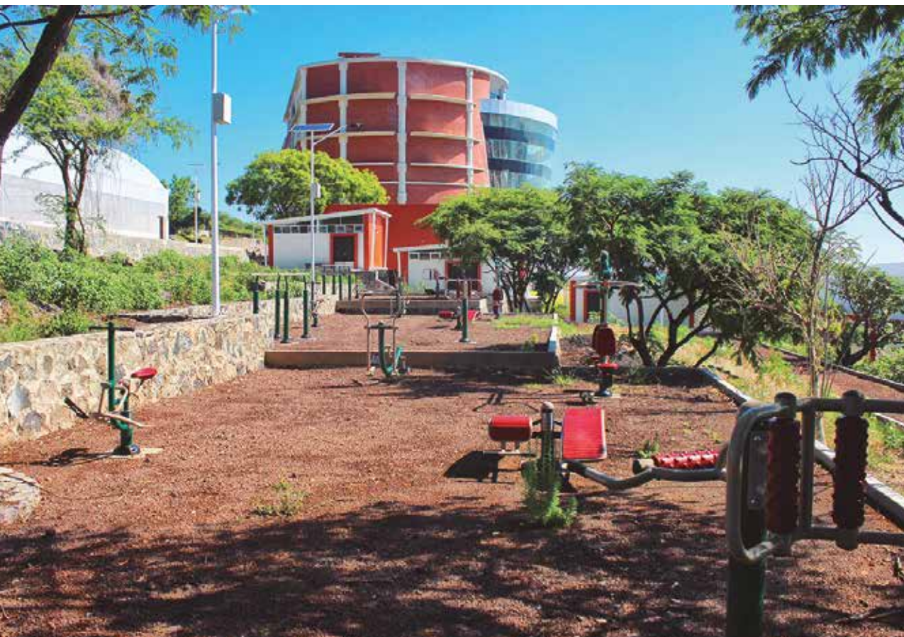
Espacios para ejercitar el cuerpo una vez que hacemos lo propio con el intelecto.