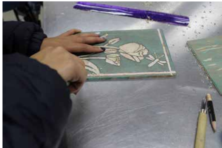
Arte y creatividad para el goce estético.