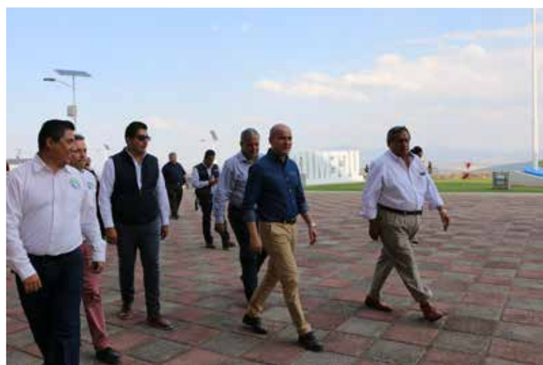
Visita del gobernador y el secretario de Educación.