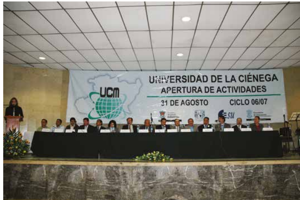
Inicio de actividades.

egreso de la primera generación se publica un Plan de Desarrollo Institucional 2010-2022 (PDI) en junio de 2010, un primer corte de caja de los retos y cumplimiento de objetivos de la novel institución, mientras las nuevas generaciones se trasladan a las nuevas instalaciones en agosto de 2010.