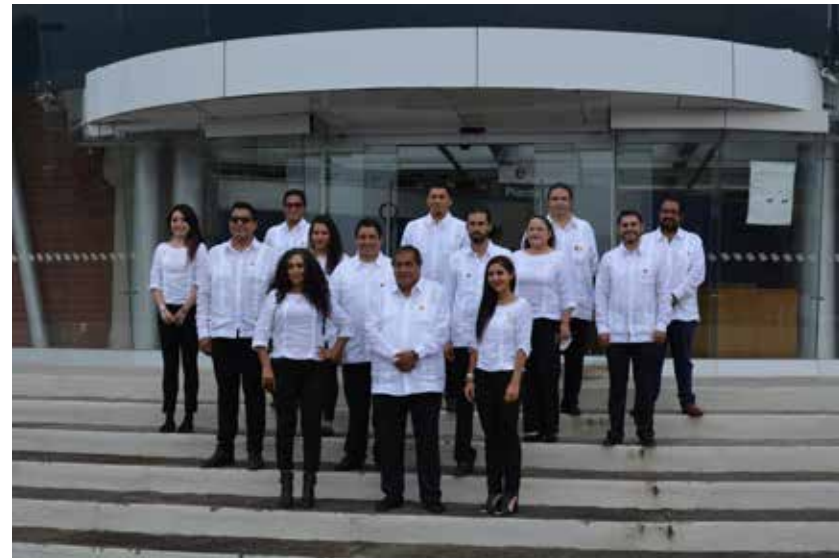
Personal de estructura.