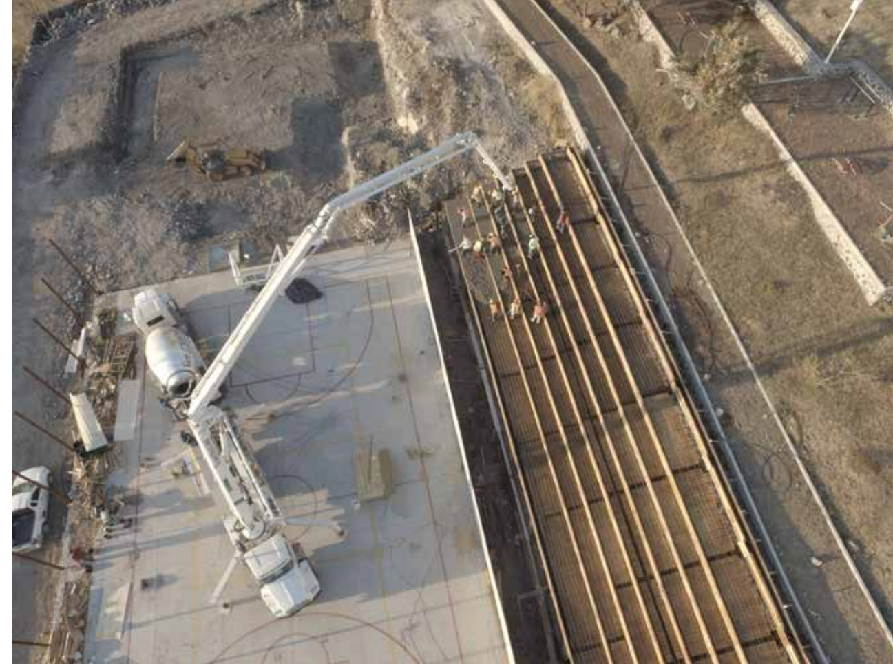
Crecimiento a la vista.