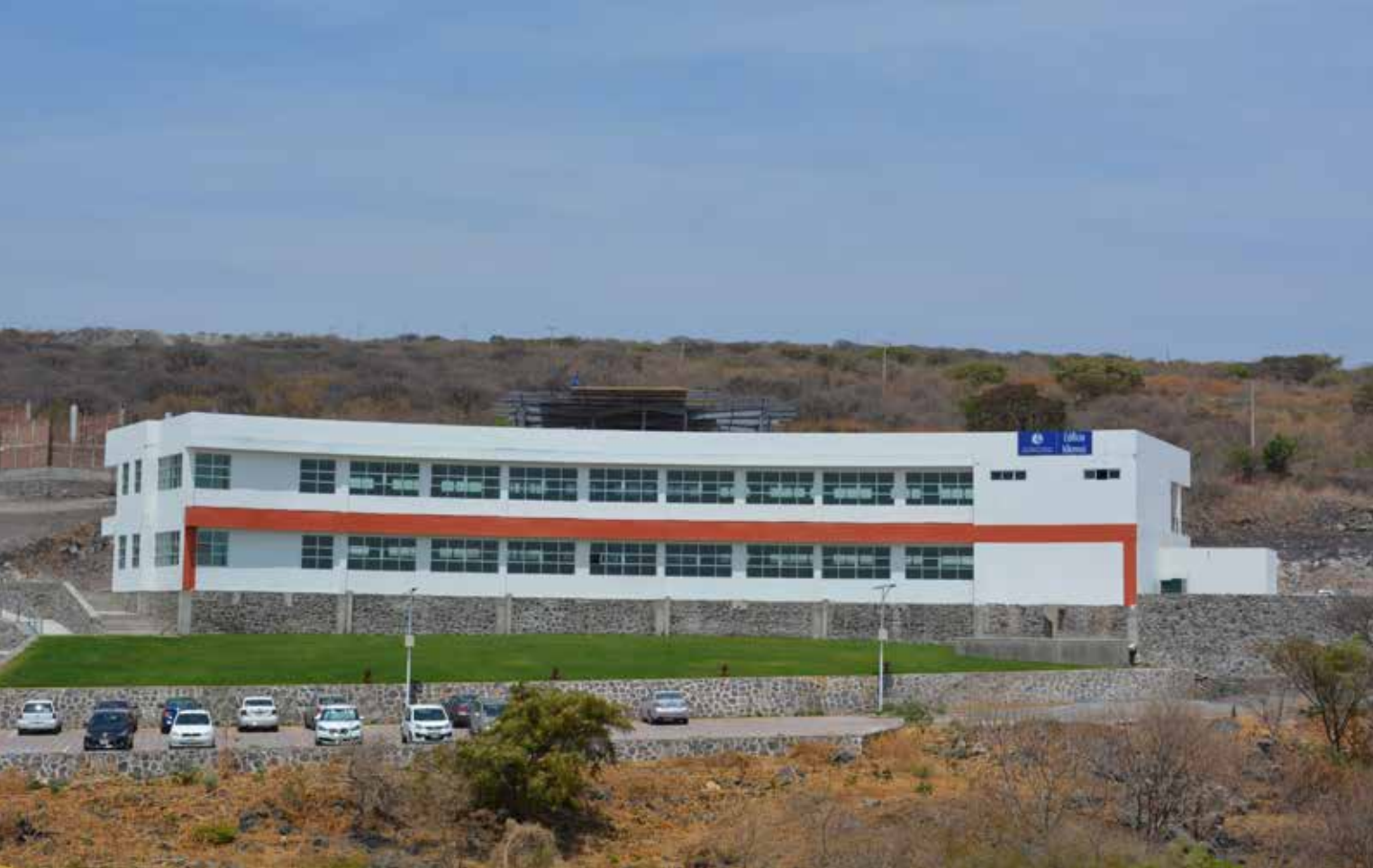
Como dijo el poeta: «caminate no hay camino...»