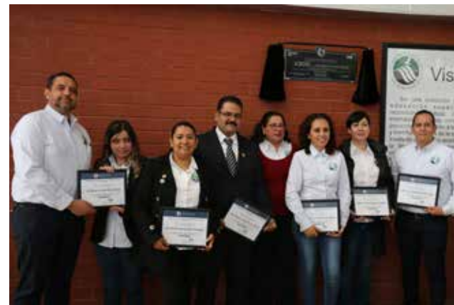
El compromiso es brindar educación de calidad.