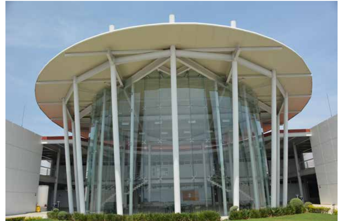
Nuestra casa es tu casa. Bienvenido.