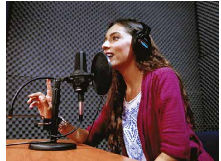
Vanguardia e innovación a la vista