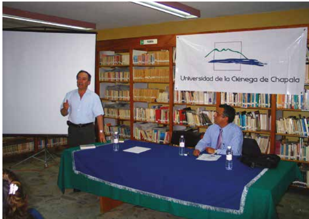
Campaña de difusión sobre el proyecto educativo.

desarrollaron una serie de talleres, conferencias y entrevistas en medios informativos para dar a conocer la oferta educativa y los sistemas de enseñanza de esta nueva institución; para el segundo, se llevan a cabo negociaciones para determinar la administración de los recursos y su aplicación en la primera etapa de construcción.