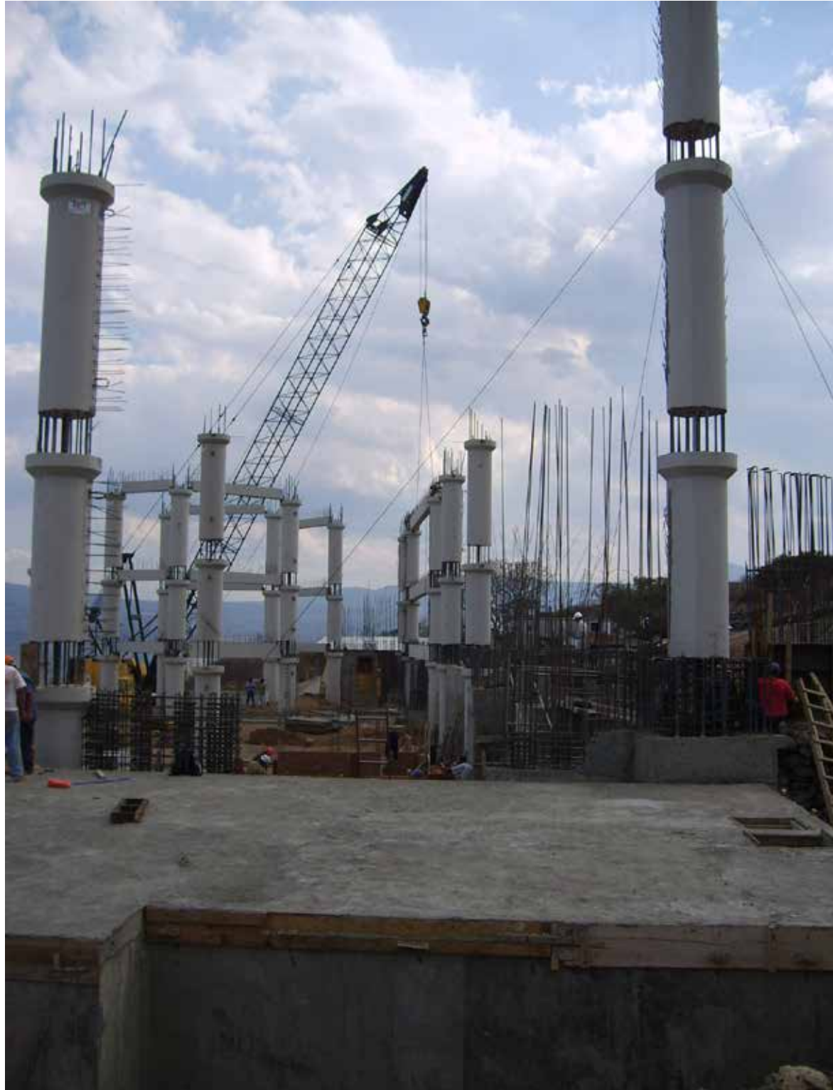
Materializando el proyecto.