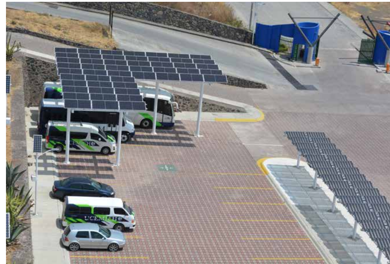
A la sombra de las ecotecnologías.