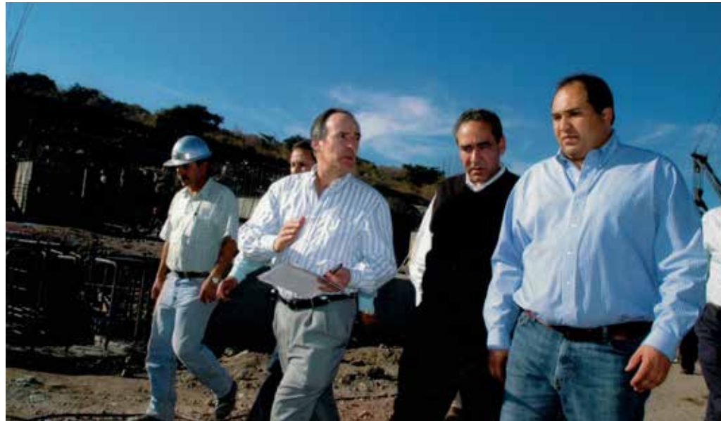
Lázaro Cárdenas Batel supervisando la obra.