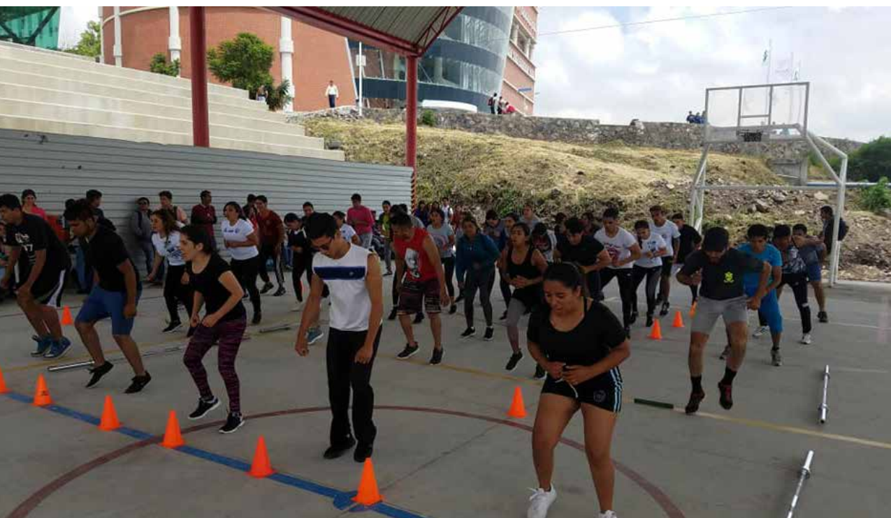
Mente sana en cuerpo sano.