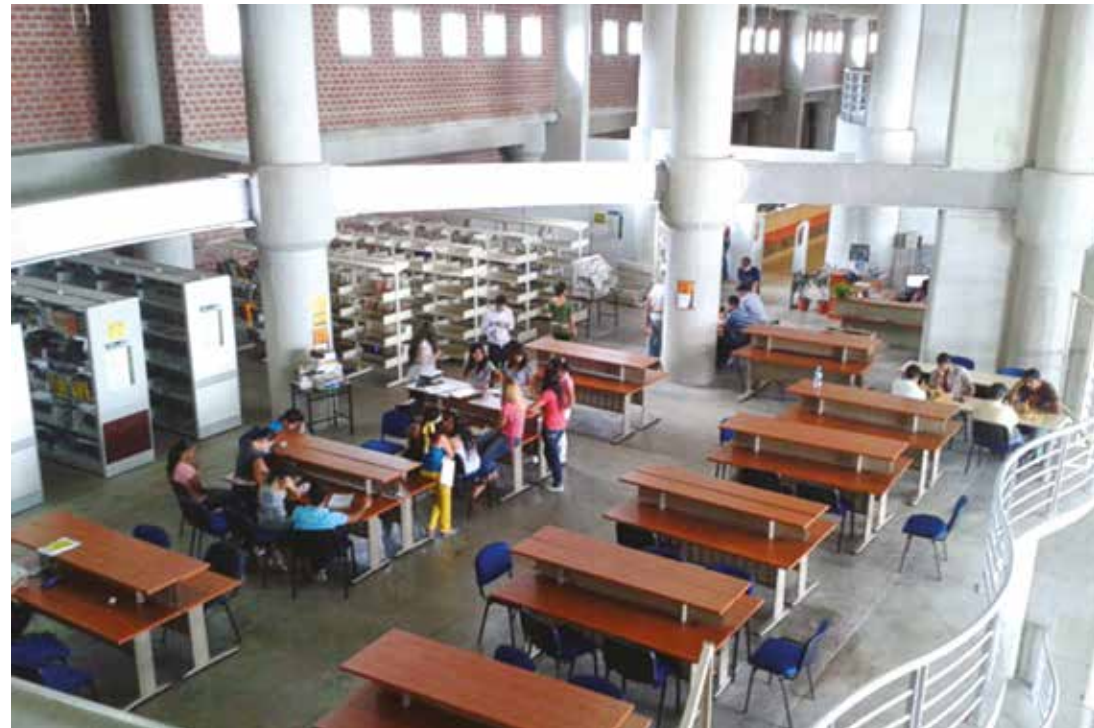
Espacios para sanar la ignoracia y el cuerpo.