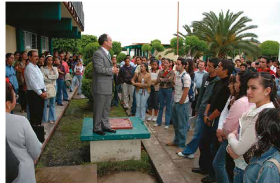
En las instalaciones del Conalep Sahuayo arrancó el ciclo escolar en el año 2006.