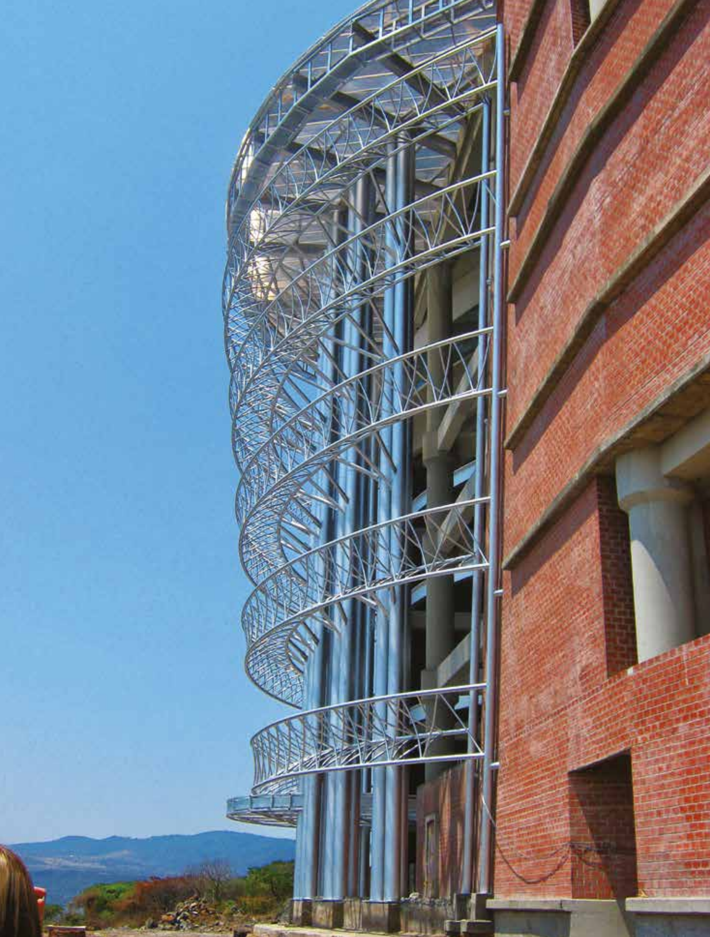
Nuestra institución es más que hierro colado y concreto.