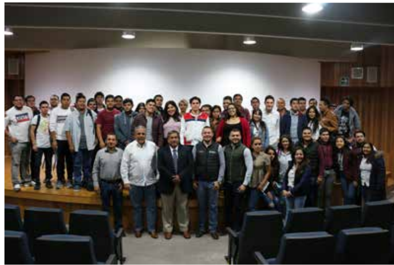
Forjando el futuro desde nuestro presente.