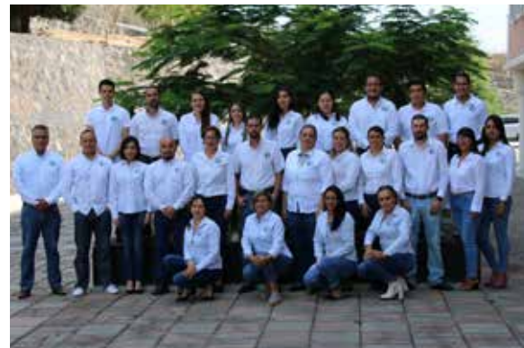
Secretaría de Planeación.