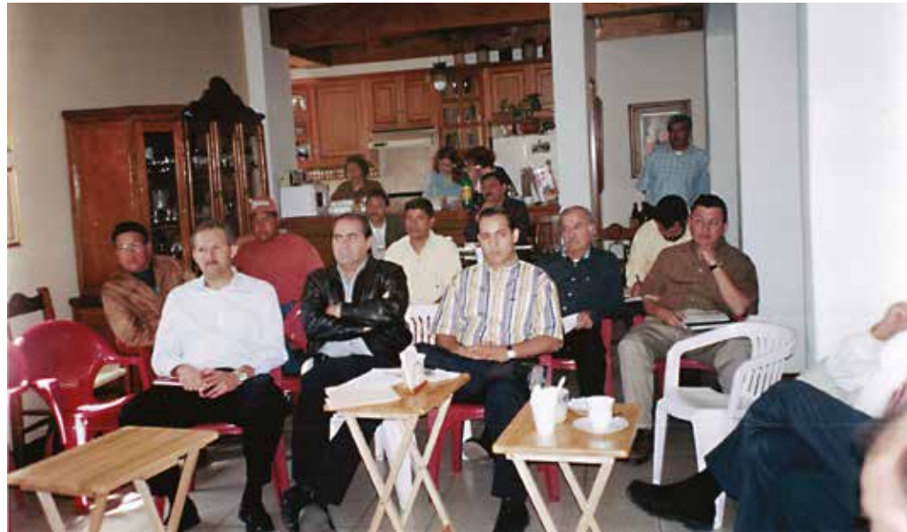
Reuniones iniciales del proyecto universitario.