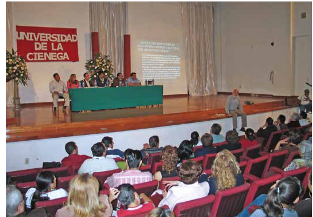
Promoción de la oferta educativa

Con un argumento harto seductor, promovía la nueva institución diciendo: «La universidad desarrollará una diversidad de lugares y acciones para que el aprendizaje ocurra, tanto dentro como fuera de la universidad. Entre ellos destacarán ambientes de aprendizaje cooperativo en que los estudiantes contarán con el apoyo de tutores y aseso-