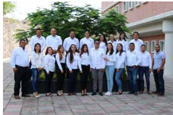
Secretaría de Administración.