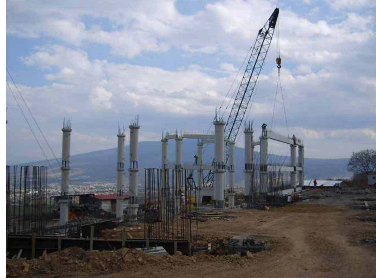
Si los pilares son fuertes, la estructura perdurará.