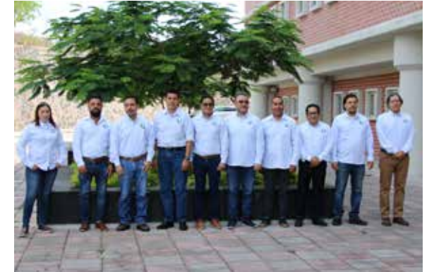
Estudios Políticos y Gestión Social