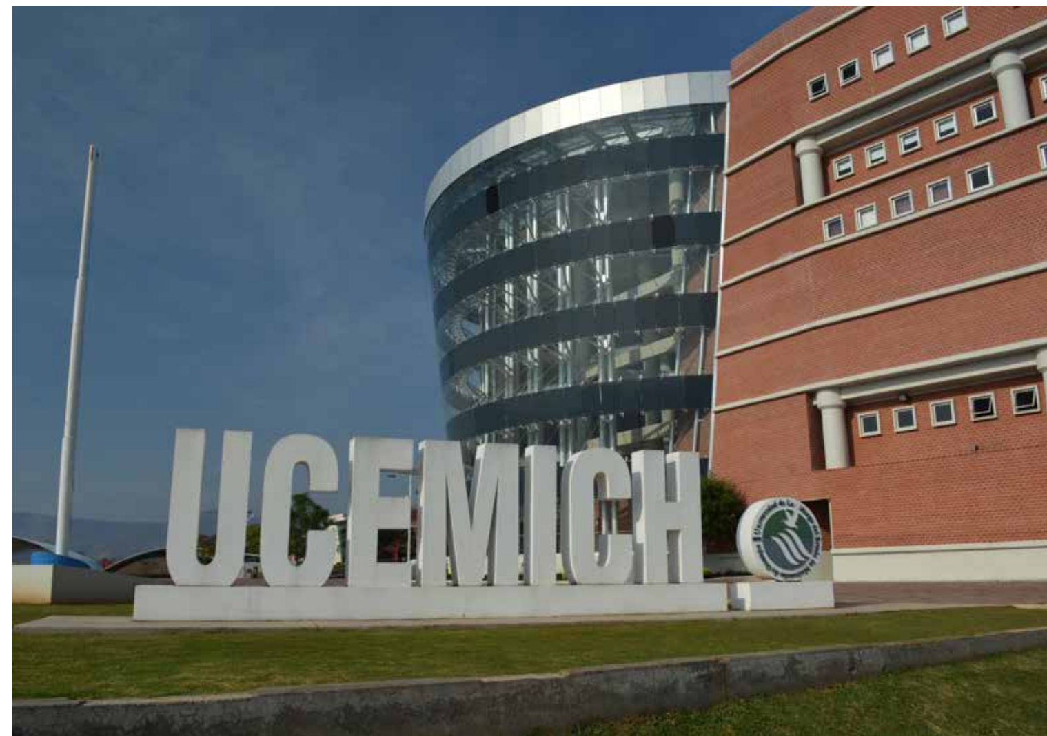
Yo soy UCEMICH.